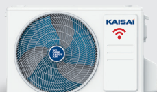
Jednostka zewnętrzna KWX