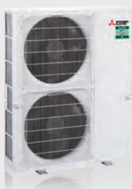
PUZ-M200 / 250YKA2