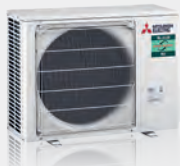
PUZ-ZM35 / 50VKA2